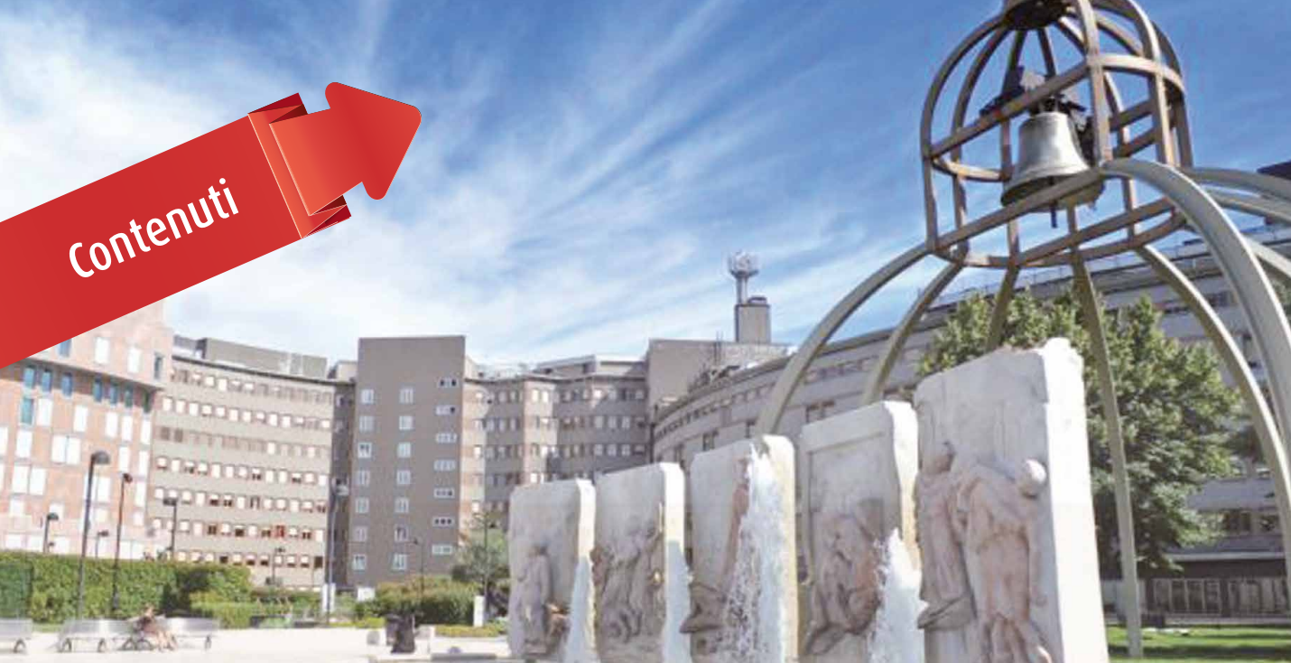
Centro Congressi San Raffaele - Milano