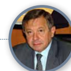
ECM F. Catanzaro

Legenda Sessioni Comunicazioni Video Poster: C= Comunicazione Orale • V= Video • P= Poster