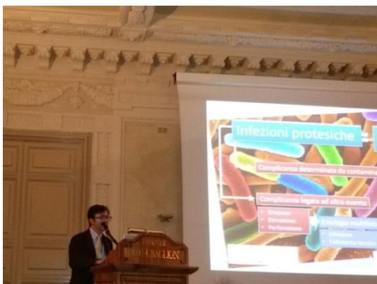
Relazione sul tema delle infezioni protesi correlate