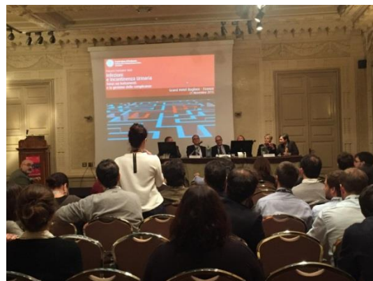
Domande dalla platea