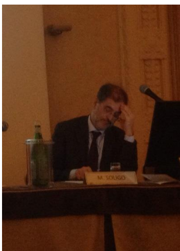
La SIUD in un momento di riflessione....