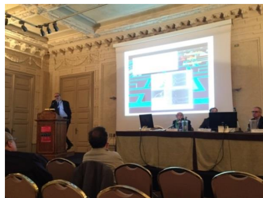
Intervento: dalla neurostimolazione alla neuromodulazione