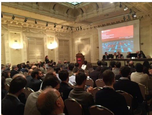
Aula attenta e partecipativa